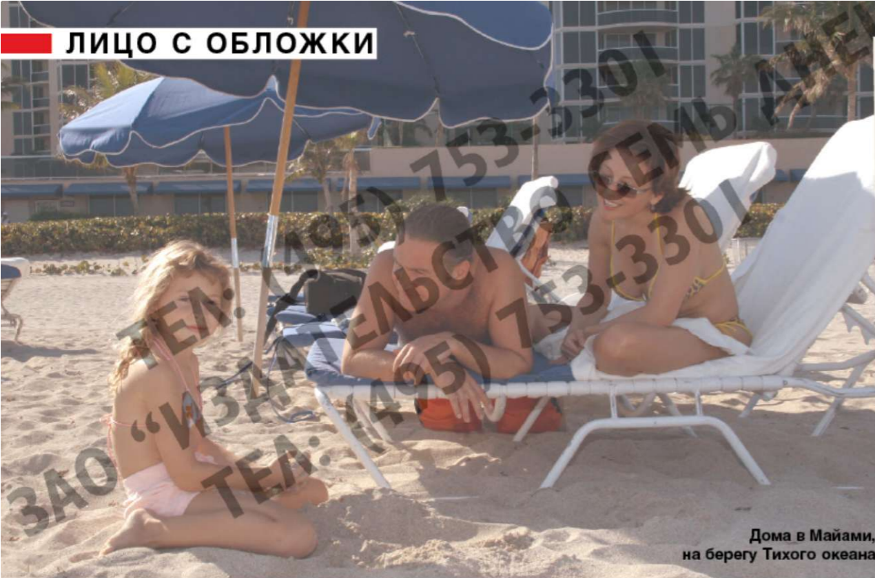
Дома в Майами, на берегу Тихого океана