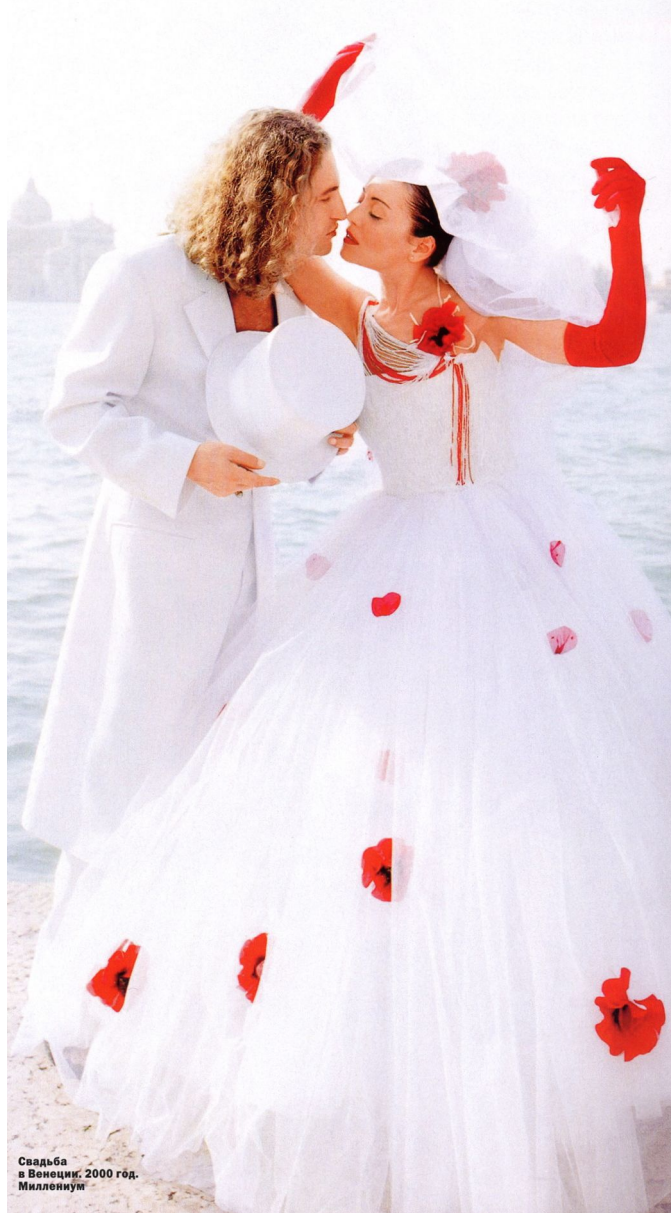
Свадьба в Венеции, 2000 год. Миллевиум